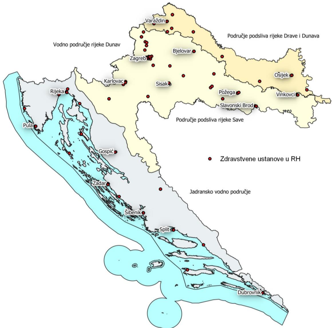
Slika 4 Karta zdravstvenih ustanova u Hrvatskoj

Zdravstvo je javna djelatnost od posebnog društvenog interesa koja pruža zdravstvenu zaštitu: očuvanje i unapređenje zdravlja, sprječavanje bolesti, rano otkrivanje bolesti, pravodobno liječenje te zdravstvenu njegu i rehabilitaciju. Neslužbeni podaci su preuzeti sa stranica Ministarstva zdravstva. Utvrđeno je 106 lokacija (bolnice, hitne medicine, laboratoriji i sanitetski prijevozi) koje su prikazane na Slici 4.