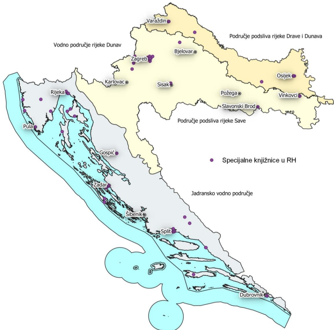
Slika 3 Karta specijalnih knjižnica u Hrvatskoj

Podaci o knjižnicama dobiveni su od Nacionalne i sveučilišne knjižnice u Zagrebu te nakon njihove obrade, utvrđeno je da postoji 106 specijalnih knjižnica koje su prikazane na Slici 3.