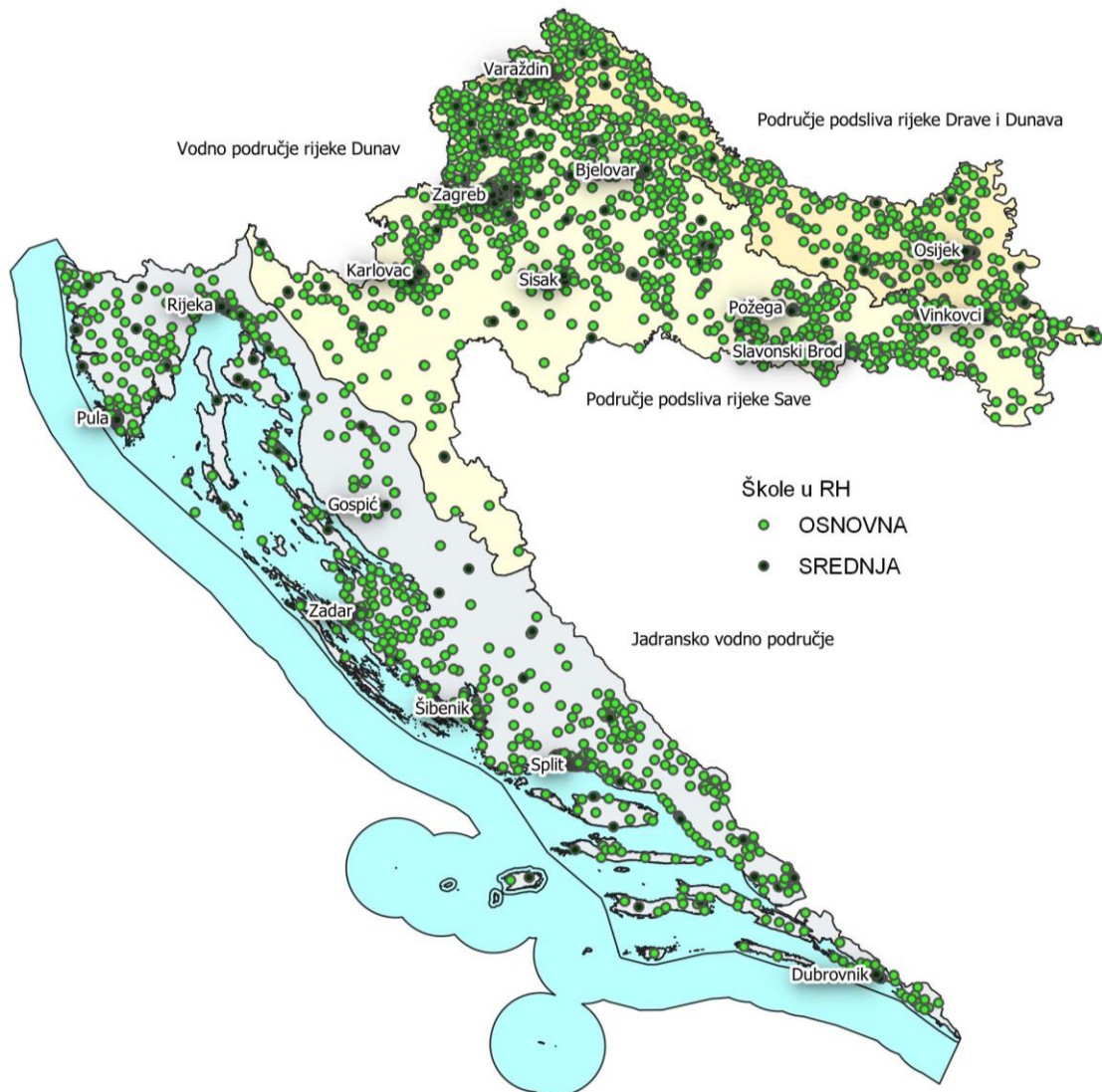
Slika 5 Karta škola u Hrvatskoj

Škola je odgojno-obrazovna ustanova s nastavom kao središnjim poljem njezina djelovanja. U suvremenim didaktičkim shvaćanjima promatra se kao zajednica djelovanja svih njezinih subjekata: učenika, nastavnika, roditelja, stručnih suradnika, ostalih stručnjaka i djelatnika. Subjekti u nastavi stječu: znanja, vještine, sposobnosti i navike. Djelatnost školstva obuhvaća odgoj i obavezno školovanje, druge oblike školovanja djece i mladih te školovanje odraslih osoba. Službeni podaci o školama su dobiveni od Ministarstva znanosti i obrazovanja. Nakon obrade službenih podataka utvrđeno je 2030 osnovnih i 428 srednjih škola, te su njihove lokacije prikazane na Slici 5.