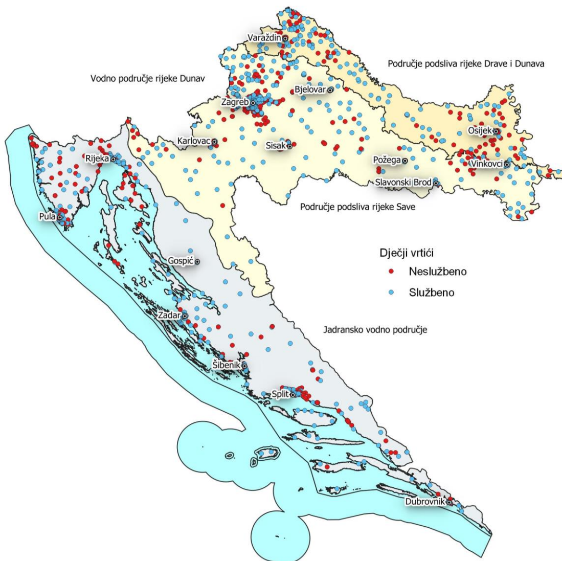
Slika 6 Karta dječjih vrtića u Hrvatskoj