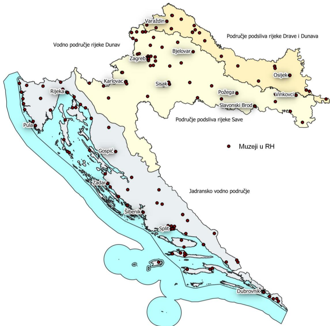
Slika 1 Karta lokacija muzeja u Hrvatskoj

Nakon obrade podataka dobivenih od Muzejskog dokumentacijskog centra, utvrđeno je da postoji 160 muzejskih centara u upisniku uz koje spadaju i muzeji dislociranih zbirki, pomoćni objekti muzeja i pojedini kulturno povijesni spomenici. Na Slici 1 je prikazana karta s 248 lokacija muzeja i dislociranih zbirka muzeja. Na karti nisu prikazane 42 lokacije pomoćnih objekata muzeja, i kulturno povijesnih spomenika koji su u sastavu muzeja. Također nije prikazano 8 lokacija muzeja za koje nisu dostupni točni prostorni podaci.